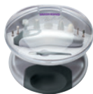
Маникюрный набор RNC-4901