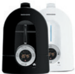
Увлажнитель воздуха RHF-3301